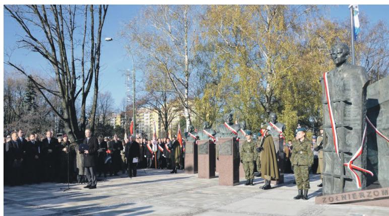
Odsłonicie pomnika płk. Łukasza Cieplińskiego i IV Zarządu Głównego WiN w Rzeszowie 17 listopada 2013 r.

W czasie wojny obronnej, 17 września 1939 r. pod Brochowem w trakcie bitwy nad Burzą, wykazując się odwagą zniszczył co najmniej sześć niemieckich czołgów, w krytycznej sytuacji zatrzymując natarcie wroga, umożliwiając tym samym przeprawę oddziałów WP cofających się w kierunku Warszawy. Za ten czyn